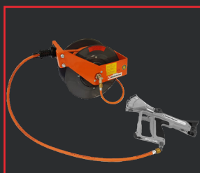
CARRETE DE MANGUERA DE GAS